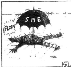
GALLEGO & REY / DIARIO 16

zuen. Ez dakit horrelakoetan legeak eskatzen ote duen susmoak gure barrukotasuna usteltzea memoriatik bizitza honetan mezezi duten gauza gutxietao bat —adiskidetasuna— ezabatzera beharzeraino. Nik, niri dagokidanez, gauza bakarra dakit, hain zuzen asko kostako litzaidakeela berriro ere nire buruari ispilu batean begiratzea baldin eta egunen batean larri dabilen lagun bati etxea irekitzeko lehenago zigorren egiaztageria eta portiera onekoa ere erakustera behartuko banu.