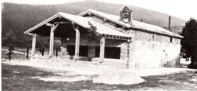
S. Antolineko Ermita (Abadiano). Espartero eta Maroto 1839.ean hemen bildu ziren.