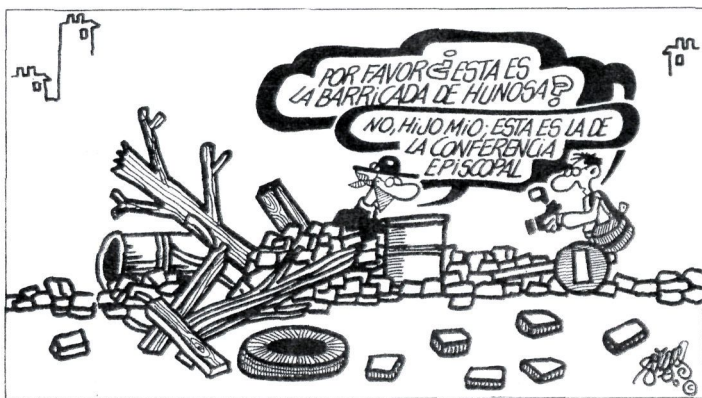
«Mesede, hau al da Hunosaren barrikada?». «Ez, seme; hau Apezpiku Konferentziarena da». FORGES / EL MUNDO

dim inposatzeko behar duen alderdia dela eta ez herri honi dagokion burujabetza lortzeko euskaldunok behar duen alderdia.