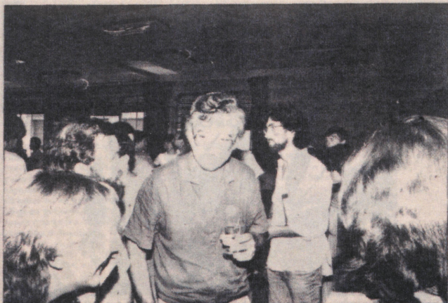
Txillardegi UEU: ikerketa eta kezken artean, atsedenerako une bat.