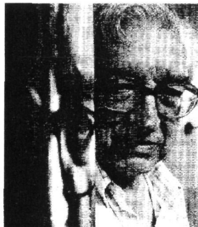
TXILLARDEGI bere omenaldia iragartzen duen afiltxaren ondoan, herenegun, Donostian.

Sinesgarritasun gutxi izan arren, lehen egunotan behintzat eraginorra da estrategia. Nazioarteko erreakzioak ikusi besterik ez dago.