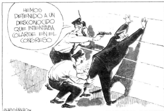
Kongresura sartu nahian zebilen ezezagun bat atxilotu dugu.

Urtero 30 bat milioi pertsona hiltzen dira gosez munduan, horietatik erdia inguru haurrak, gainera. Afrika dugu record hitis honen buruan. Baina arazoa Hirugarren munduko herrialde gehientsuenetara hedatzen da, areago populuenetan. Gerrak, lehortea, jauntxkeriak eta beste arrazoi ugari azal liteke gosearen arazoa. Baina, arazoari garrantzitsuen, eta askotan gainontzekoen eragile, herrialde azpigaratuek garatuekiko du-