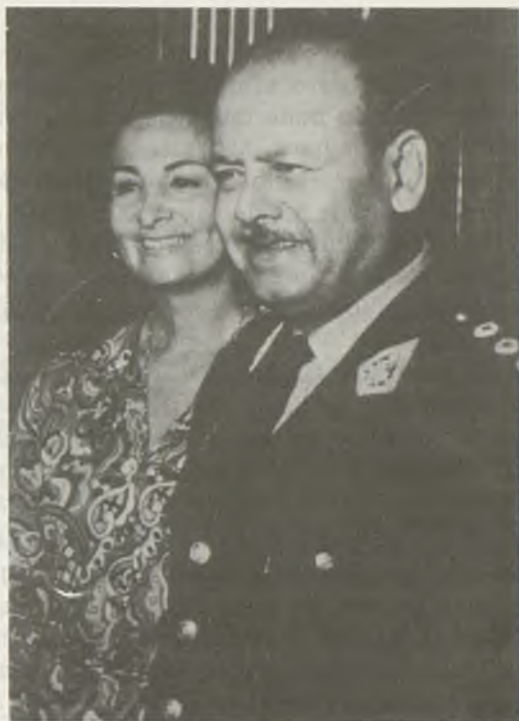
Juan Velasco Alvarado presidentea «Ketxua hizkuntza ofizialtasunaren mailara jaso du»

Paraguay izan da orain arte, bertako bigarren hizkuntza guaraniera izanki.* Oraingoan Peruko Gobernuak egin du bigarren pausoa, Inken ondorengoen hizkuntza ofizialtasunaren mailara jasotzean. Izan ere, ba zen garaia, aspaldidanik bertako intelektualek —Vargas Llosa eta gisa bereko Unamunokideen salbuespenaz*— ketxuaren aldeko kanpaina gogor bat egiten ziharduten eta