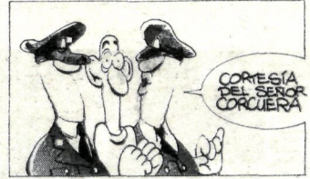
ANGEL/GUILLERMO / EL MUNDO

Kontua ez da akordioa absolutuzatzea edo gehiegi goralteza, baina herri hau ez dago ohiuta halako adostasun maila lortzera, eta horrelako bat erdiesten denean, lan serio eta luze baten ondoren, ematen du esperantza izateko arrazoirik. Gogoeta honekin loturik, sinatu dugun akordioak balio izan du nabarmen uzteko euskal sindikatuen gehiengoak baduela borondate argi bat lan harremanetako euskal esparruaren aurrerapena eta garapena batera garrri egiteko jarrera irekiekin, mugimendu sindikalaren osotasunarekiko elkarlanean aritzeko jarrera malguekin.