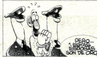
—Baina... eskubidin hauek urrezkoak dira! —Corcuera jaunaren mesede.

Eusko Jauriritzak, Confebasket eta sindikatuek euskal komunitate autonomoan Formazio Iraunkorraz sinaturiko akordioak garrantzi handia du berez, eta ez du oharkabean gelditu behar. Gaia, langileen prestakuntza iraunkorra, estrategiko deitzen ditugun horietako bat da. Hitzartutako ereduak baditu elementu berritzaile batzuk euskal errealtateari eta bertako heziketa beharrei egokitzeari dagokionez. Baina badira akordioaren beste gako batzuk ere aipatzea merezi dutenak; artikulu honetan horietako batez ariko naiz.