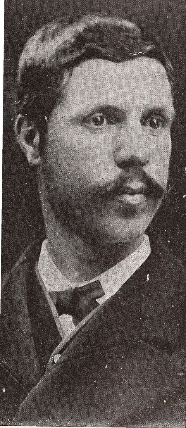
Ludwig Salvator Artxidukea. gazterik oraindik. Gizaseme egokia, baina urteak, eta barne-atsekabeak, asko zakartuko zuten gerora.