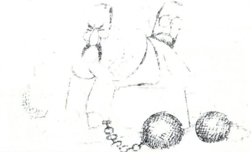
Balitzko etorkizuna: «Hemen ez gaude ham gaizki. Egungero bost minutu ematen dizkigute mehatxu egiteko».

Ertzaintzak, Eusko Jaurlaritzak, azkenean deskubritu dute bideoen bidez HB inplikaturik dagoela ETAk enpresariak egindako estorsioan. Orain arte itxarotera eztenkagarria izan den arren. Giro erradikalak bizi izan ditugunok badakigu nondik da izaten tiroak. Eta HBren zirimismo kriminala, ETArekin duen kolaborazio estua justifikatzen ahaletinduta. Madrilgo sarraski izugarriarekin batean gertatu da... Felipe Gonzalezen hasierre ere dugurria da. Lastima da ordu