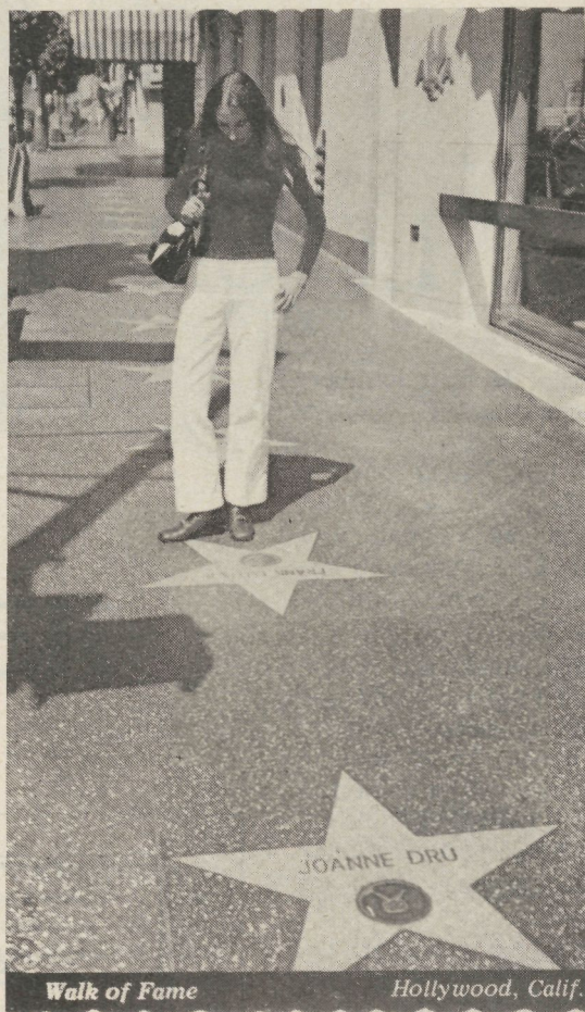
Walk of Fame

Baina hunkigarriena, agian, beti bisitari isilez bete, «Chinese Theater»Ko aurrekaldea da. Urteetan barrena, harlosa bana eskaini zaie artistarik sonatuenei; eta hauek, nork bere txandan, esku-ahurren eta zapaten aztarnak utzi dituzte zimentuan betirako; beren eskuak hitz labur batzu eta sinadura erantsiz. Nola uka batzuek eragiten duten zirrara? Mickey Rooney (1938), Norma Shearer (1927), Richard Widmark (1949), Clark Gable (1937)... Eta, ia patioaren erdian, gaurko gazteek ezagutzen ez duten Shirley Temple neskak famatua (1935): «Love to you all» (= maitasuna zuei guztioi). Eta beste