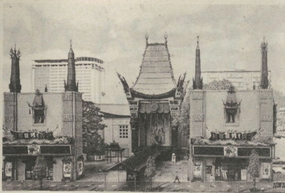
Hollywood-eko Txinatar Antzokia.

ne-ametsi dagozkio, urteetan barrena horren zinki iltzaturik egoteko? Artista horiek, bestalde, ez dira gaurkoak... Zer gertatu zaio zineari? Ni naizen arloteak ez daki; baina agian bestek zerbait azal lezake. Telebistak ziznez ordaindu al du «amets-lantegi» hura?