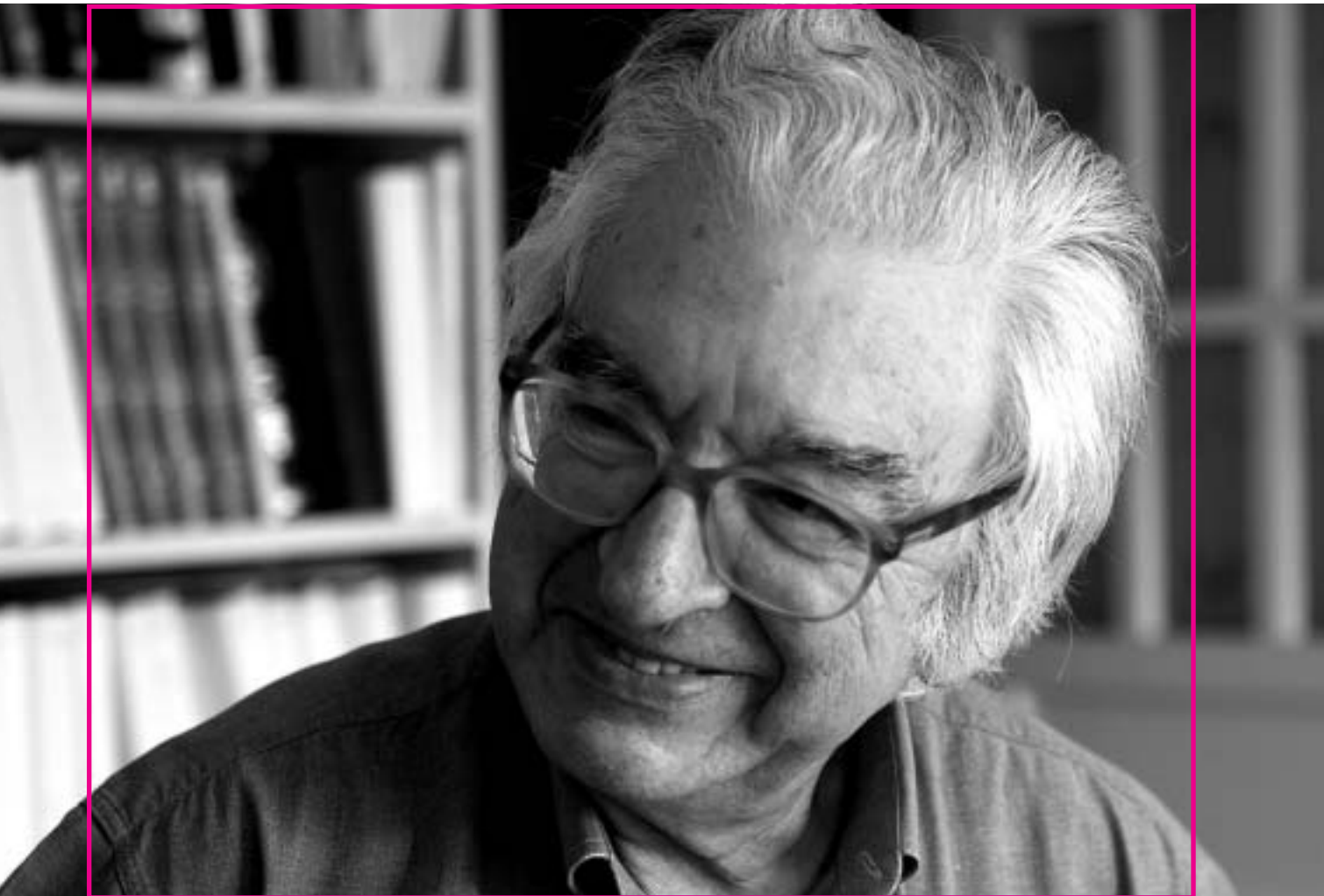
Txillardegui Donostiako Parte Zaharreko etxean.

zela eta... Total, gerra etorri zenean ni gogoratzen naiz etorri berria nintzela Antiguara.