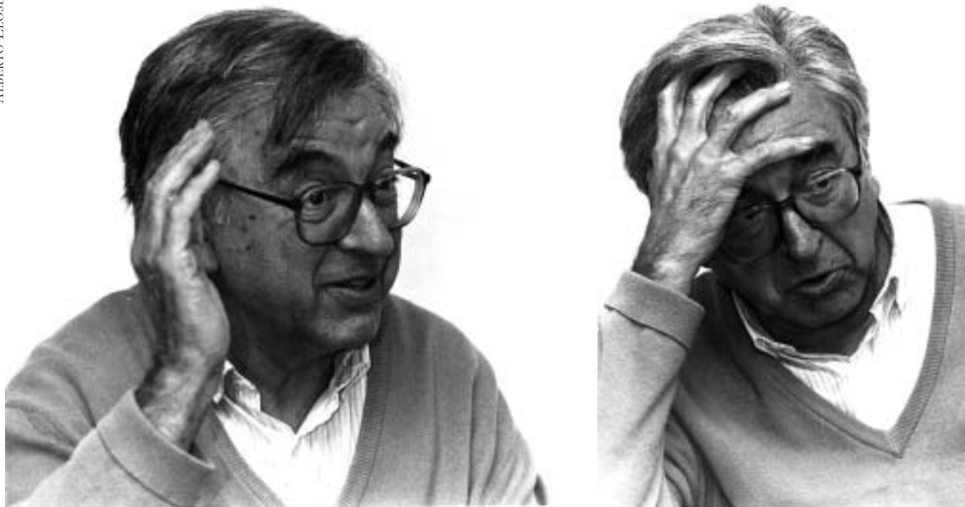
1994an ARGIAN egindako elkarrizketa bateko argazkiak.

tan 1947ra arte jendea fusilatu zuten. Gerra bukatu eta segitu egin zuten.