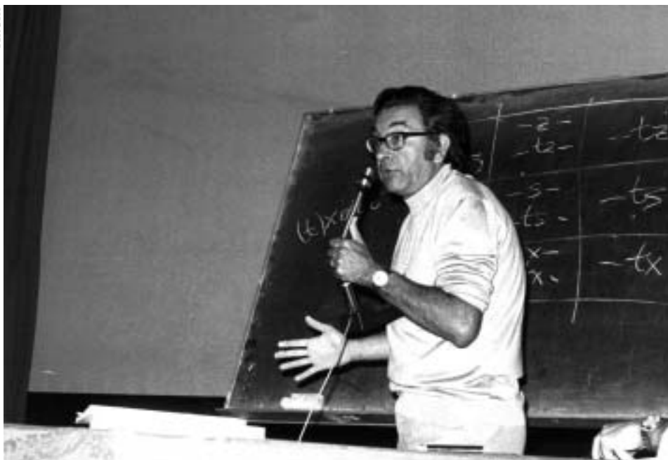
1979an Bergaran, Euskaltzaindiaren VIII. biltzarrean.