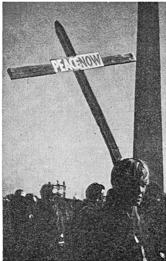
Bi teatroot Ipar Ameriketan sortuak dira.