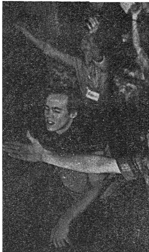
Zamarra-gaiean, Jesusen irudia.

Eta mezu gisa? Ezta ere. Nere uste apalean, halere, esan ezin daiteena da, hor azaltzen den hori dela bakar-bakarrik benetako Jesus, eta ez hor beste nonbait presentatzen diguten Jesus iraultzaile hori. Hitz hauekin ez bada ere, gauza bera esan du Daniélou kardinalak. Nik ez dut uste hala denik, ez dudalako pentsatzen teatro hontan Ebanjelio osoa dagokeenik. Daniélou-ren kritika honek on baino gaitz gehiago ez ote dion egin teatro honen izpirituari nago.