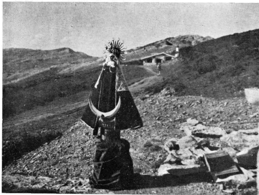
Imagen de Ntra. Sra. de Aránzazu que se venera en Igaratza (Aralar). Al fondo el refugio y el monte Pardarri.