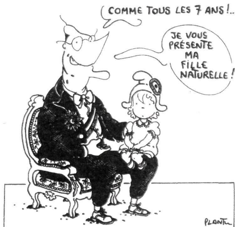
Zarpi urtero bezala!... Nire neska alaba aurkeztu nahi dizuet!