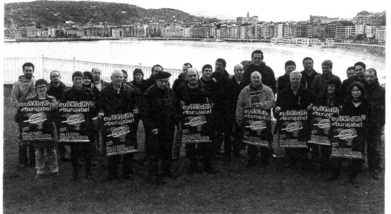
Miramar jauregian egindako agerraldia. Txillardegi-erdian manifestazioaren harira omenduko dute. EHE

hartu zuen. Ipar Euskal Herrian, Parisen edota Bruselan bizi izan zen, idazketa eta engaiamendu politikoa uztartuz. 1967n ETA utzi zuen, V. Biltzarra eta gero. ■ ESB. 1977an, behin Hego Euskal Herria itzultita, politikagintzan murgildu zen. Euskal Sozialista Biltzarrea (ESB) alderdiaren sortzaileetako bat izan zen. ■ HB. Urte batzuk geroago Herri Batasuneko (HB) senadorea izan zen. ■ Aralar eta EAE-ANV. Aralarri babesa eman zion hasiera batean, baina alderdia utzi zuen, 2007an, Aralarrek berak Eusko Jaurlaritzak antolatutako ETAKo biktimen aldeko ekitaldi batean parte hartu zuenean eta Ezker Batuaren koalizioan joatea erabakitzerakoan. 2008ko urtarillan, EAE-ANVeko kideekin batera agertu zen hedabideen aurrean hauteskundeetarako hautagaitzerrenda erregistroan aurkeztera joan zirenean. o sorzabal@hitza.info