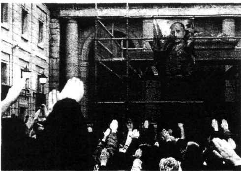
Francoren aldekoak aurten, Madrilan, diktadoreari gorazarre egiten.

baina egia kontrakoak da: ETB2 euskaldunak espagnolizatzeko tresna da. «Nazio» hitza desagertu egin da. Eta bekatu nagusiak gaur (18-98 makroprozesoen garbi ageri denez) abertzaletasuna eta euskaltzaletasuna dira. Ohitu egin gara Euskal Herria hiru puskatan ikusten. Ez da dena beltza 30 urte horretan. Inondik ere ez. Baina prezioa izugarri garestia izan da: Euskal Herria askaturik eta euskaldundurik ikusteko projektua, utopia bihurtu da. Gure herriko eskualde eta giro askotan, gehiegitan, benetako Euskal Herria eraikitzeko projektua hil baita.