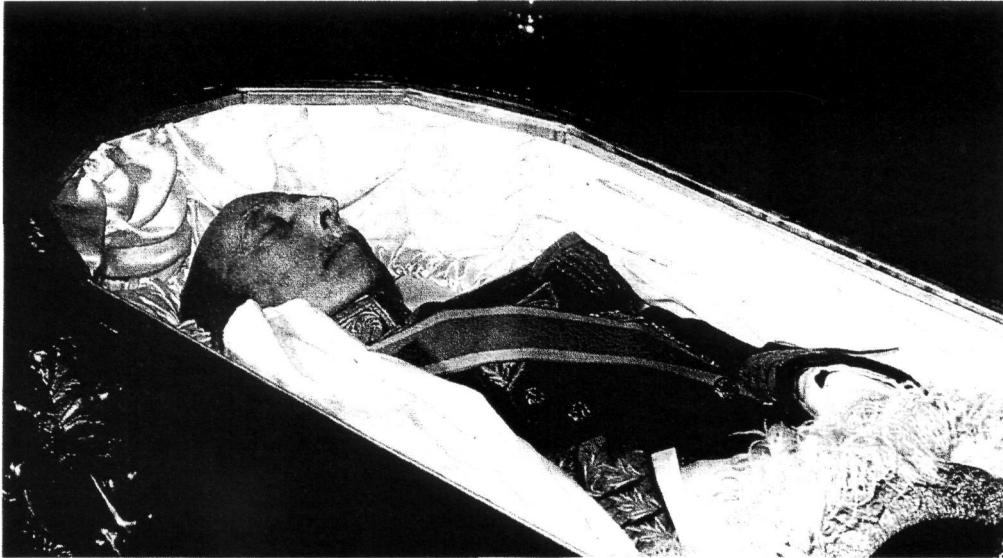
Francisco Franco Bahamonde militar eta diktadorea, hil berritan, Madrilgo El Pardo jauregian.

Euskal herritar askorentzat, Franco diktadorearen heriotza albiste pozgarria izan zen. Frankismoa diktadorearekin batera lurperatuko zutela uste zuten gehienek. 30 urteren buruan uste hori gauzatu ote den ala ez, ñabarduraz beteriko erantzunak bil daitezke. ● Testua: A. Iban