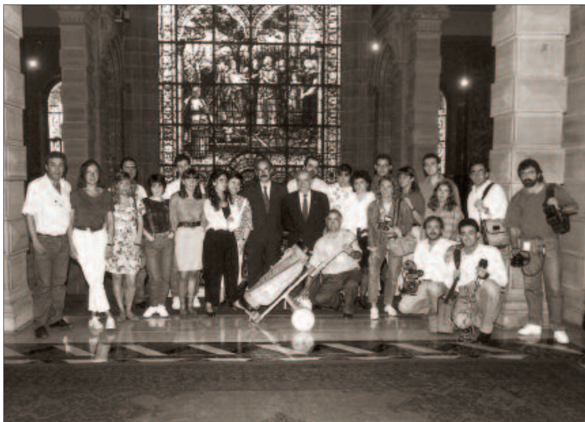
Diputazioan, kazetarien azken agurrean, hauek egindako opariarekin (1991)