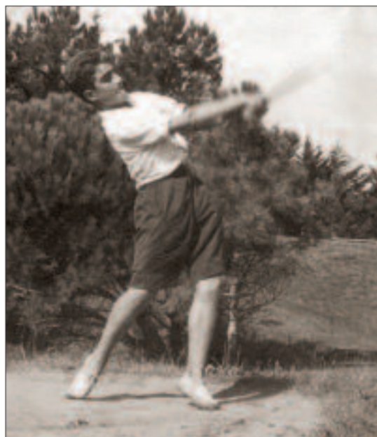
Zarauzko golf zelaian caddie lanetan jardun zen (1947)