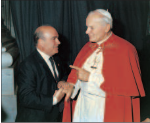
Erroman, Aita Santuarekin