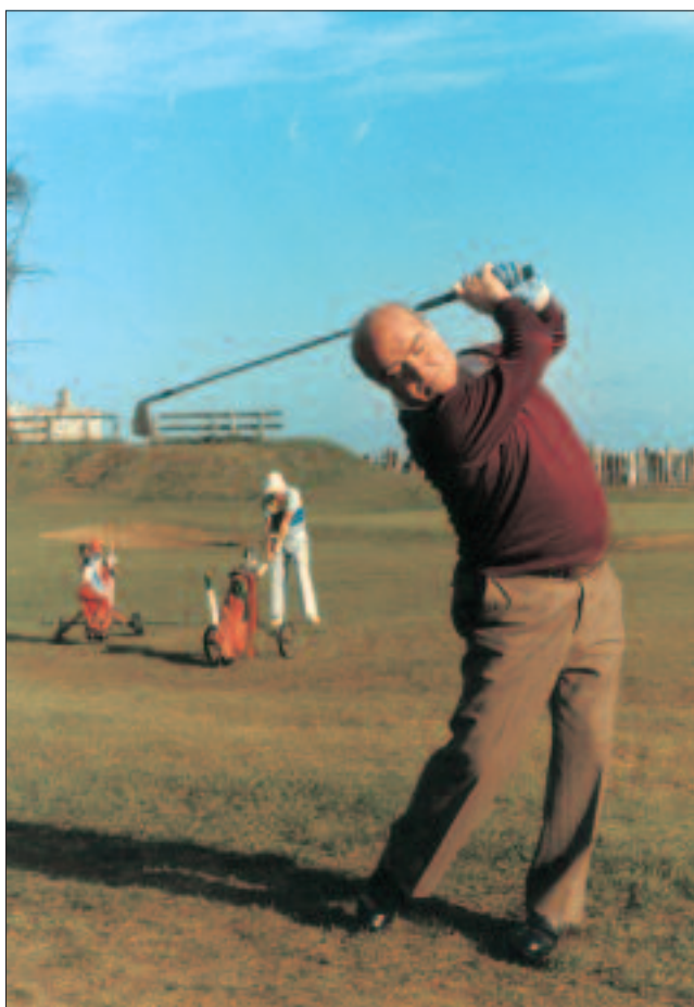
Zarauzko golf zelaian (1990)