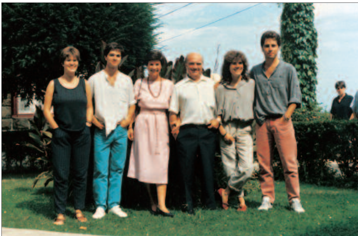
Seme-alabekin zilarrezko ezteietan (1986)