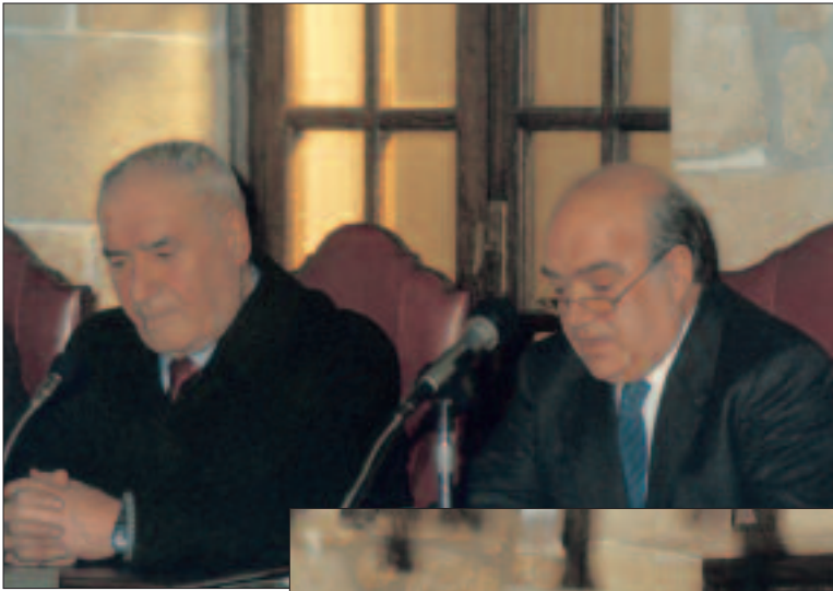
Basarriren omenaldia Zarautzen (1985)