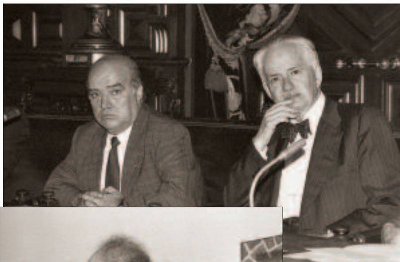
Diputazioan Julio Caro Barojaren hitzaldiaren aurkezpenean (1989)