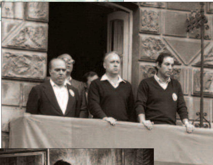
Zarauzko Batzokiaren inaugurazioan Imanol Murua, Xabier Arzallus, Carlos Garaikoetxea eta Xabier Aizarna (1979)