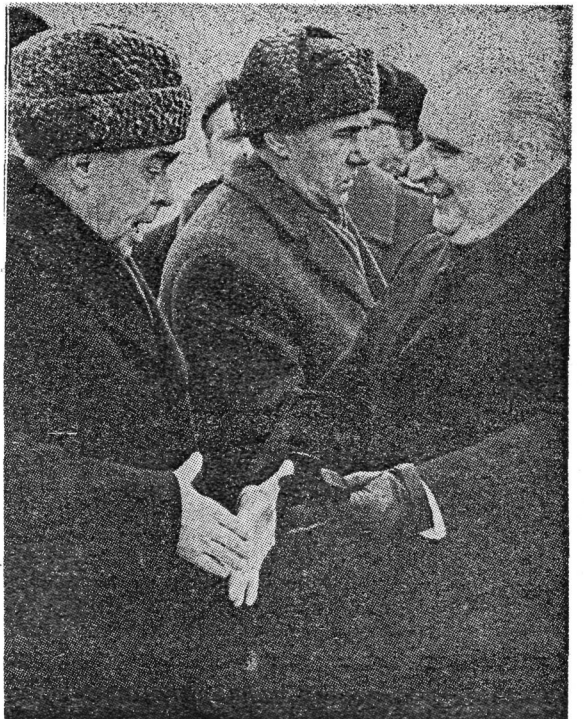
Brjnev, Pompidu jaunari agur egiten, urtarrilaren 11ean, Matxultxiko aldeportuan. Bien erdian, Gromyko jauna

Mende honetan, bi problemaekin konfrontatu behar izan dute sistema politikoei. Dirudienez, mendebaleko demokraziak ere ikasi dute krisi ekonomikoak errenditzen. Problema sozialak burubidatzen, ez dute oraindik aski ikasi. Sobiet Batasunean, ekonomia burubidatzeak ez du mendebalean baino buruhauste gutiago ematen, inolaz ere. Problema sozialak hobeto konponetzen direla, ematen du: eskola, asistentzia soziala, lantokia, seguruak. Beraz, segurantzia sozial gehiago dago, eta mendebale demokratikoan baino askatasun gutiago, segurantzian truke. Demokrazia ez bait da medio bakarrik, helpeide politiko hutsik, hor finkatzen da