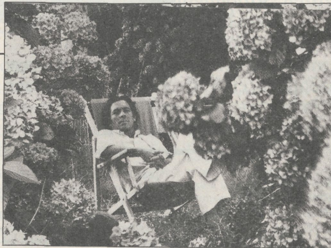
«Aste kulturalen planteiamendua absurdoa, kulturak iraunkorra izan behar du eta».

S. — 65eko udazkenean biok izandako elkarrizketa baten ondorioz sortu zen «Gaur» taldea. CATEk eratzen zuen «Certamen de la pintura vasca» delakoari aurre egiteko erakusketa paraleloa egitea deliberatu genuen, arte sortzailea eta garaiko politika zehatz bati jokua egiten zion artearen arteko ezberdintasuna ikus zedin. Oteiza, Basterretxea, Mendiburu eta Txillidagana jo genuen. Azken honek Balerdiren presentzi jarri zuen baldintza gisa. Horrek atzeratu egin zuen projek-