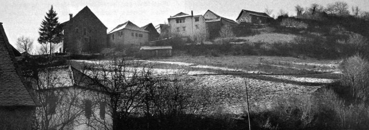
Ustarroz, Erronkariko herri bat da.