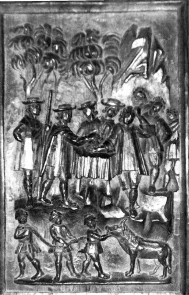
Izabako elizan hiru behien ordainketa, Koruko aulkietako irudi landuak. Talla que representa el tributo de las tres vacas, en la sillería del coro de la iglesia de Isaba.

keteri erantzuten diote gaurko isogloa horiek. (Ikus, La lengua vasca -ren 53 orrialdean). Hala dirudi, eta aintzinako zatiketa tribal horrek, gutienetik, Eneolitos garaira arte eramango gaitu eta tribu hoiek larraldaketa edo trashumanziari loturik heldu zen. Horregatik, hain zuzen, isoglosak Pirineoaren ifarretik Hegoaldera kruzaturik aurkitze hau.