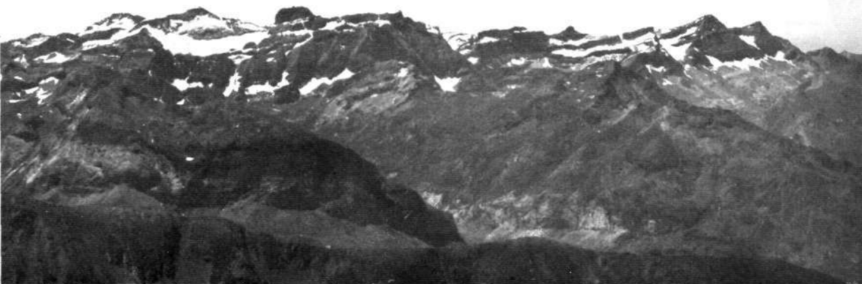
Marboreko mendiak Piclong-dik ikusiak. Pirineo erdi aldean. El macizo de Marboré desde Pic Long, en el Pirineo Central.

rráneo peninsular y pasa por el Pirineo, y fue usado también en el Eneolítico de Bretaña. Conexión, sin duda, favorecida por la trashuman- cia pastoril.