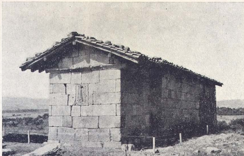
Ermita de San Julián de Zaldueño, lado oriental, recién iniciadas las excavaciones. Agosto de 1979.