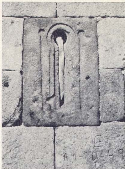
Ventana prerrománica de San Julián de Zalduendo (Alava)