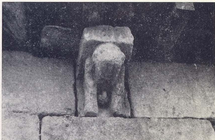
Uno de los canes de San Julián que probablemente representa la fertilidad.