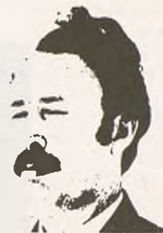
Gudari historikoak eta aberriaren gurasoak omen dira.

Krisi ekonomikoa da gertatua, batzumentzat. Politikoa, beste batzumentzat. Haserrearentzako eta grebara deitzeko arrazoi ekonomikorik ez da falta. Mundu krisiak biziki nabaritu da fosfatoaren eta ehunaren esportapenetan. Sikateak, bestalde, emaitzik hoberenak lehortu zituen 1977.ean. Emeki emeki besterik ez dira igaten lansariak. Gafsako meatzetako langileen eskabideen aurrean Gobernu gogortu egiten da. Abenduaren azkenean krisi soziala begien bistakoa da.