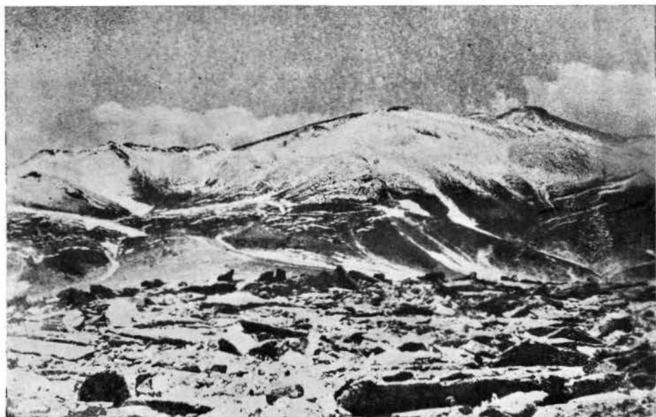
EL CERRO «LOS OJOS DEL SALADO».