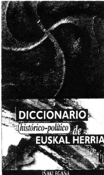
Un diccionario con otro enfoque.

Y también es la expresión de los conceptos universales que, como vasos, manejan en nuestra particularidad como los pueden manejar en