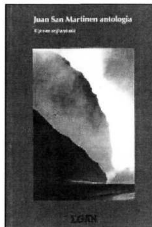
Liburu berriaren azala