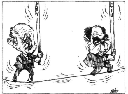
ZULET / EL CORREO ESPAÑOL