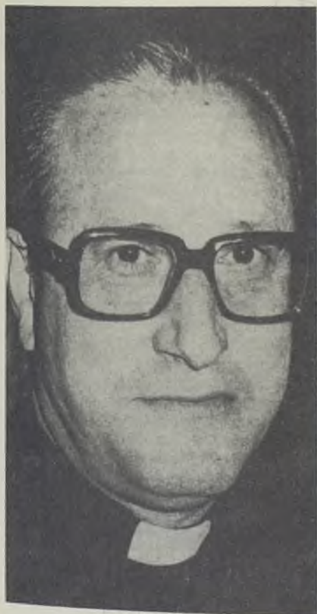
José María Setien