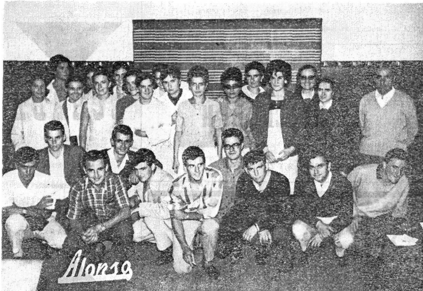
Alfabetatze-saioak asi ziranean auxe zan bear-bearrezkoena: maixu talde bat gertutzea. Ortarako ikasaldi batzuek egin ziran eta emen ditugu ikasaldi oietan parte artu zutenak.

—Herriari gagozkiola bi alderdi ditugu hemen. Lehenik herria nola gosetu ikusi behar dugu, eta bigarren nola jaten eman. Lehenbizikoak propaganda ta dibulgazio lana eskatzen du. Konsumo ta kompetenziaren gizarite hontan beste biderik ez baidago. Herriak akulu baten beharra dauka, zati handi batez proletario izanik ere bere egarrietan aburgesatuta baidago. Bere izatea deskubritu arazi behar zaio. Hortarako talde bat konprometitu behar da itzartze lan hortan. Gaiak eta planteamenduak honelakoak litzake: «Herrietasuna ta hizkuntza», «Langile kultura zer den», «Gizon euskalduna historiaren hildoan», «Hizkuntza dialektika indarra bezala», eta beste... Propaganda ekintza hontan artistek, kantariak eta pintoreek, zeregin handia lukete. Bigarren ponduan, nola euskaldundu alegia, ahal ditezkeen bide guziak agortu behar dira. Legetik azken tantaraino xurgatu behar da, eta