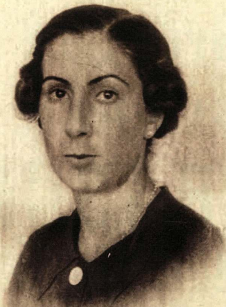
Kareaga'tar Miren Josebe: margolari bikaña;- orain ufengo Euzko Pizkuade'n egin zuan erakusketekin guziak afitu zituon.