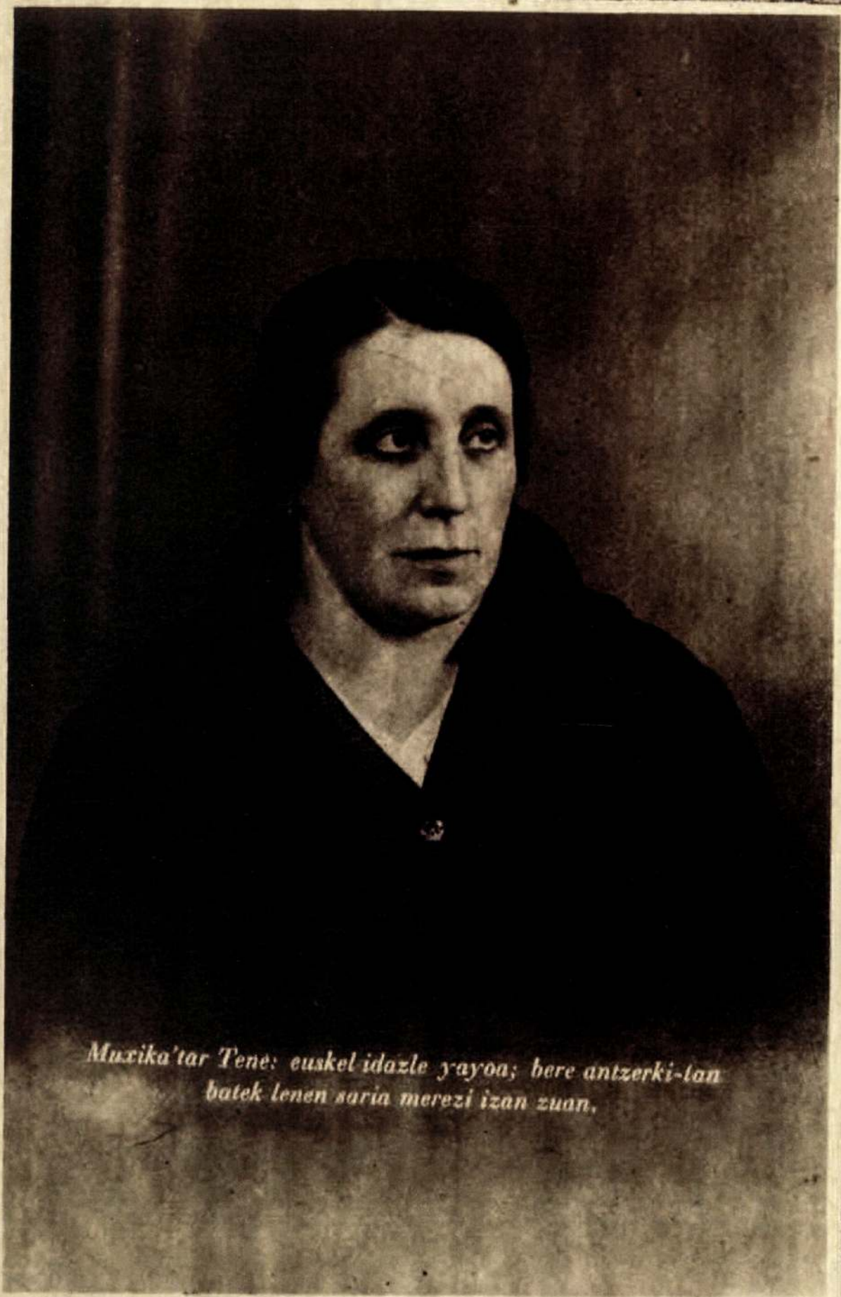
Muxika'tar Tene: euskel idazle yayoa; here antzerki-lan batek lenen saria merezi izan zuan.