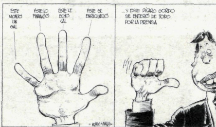
Honek GAL bat eratu zuen. Honek finantzatu egin zuen. Honek karea bota zuen. Hau aberastu egin zen... Eta potoilo pikaro honek prentsaren bidez jakin zuen guztia. RICARDO Y NACHO / EL MUNDO

Baina beste horrenbeste esan daiteke azken egunotan komunikabideek zabaldukoak. «Euskal gizartearen ahobateko erantzun» hori egunkarietako orrialdeetan, irratietako uhinetan eta telebistetako irudietan eman da, ez beste inon. Ez da egia, titular handitan jarritakoaren