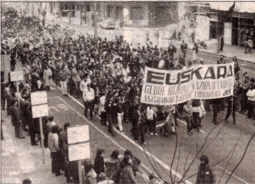
Euskaldun guztiak euskara ikastera bultzatu eta hizkuntza egoki bat eskaini.

Orain dela hilabete batzu eman genuen beste artikulua batetan "Euskararen normalkuntza kulturazkoa" deitzen genuen hori. Eta honela genion orduan: "Euskarari dagokionez, ez dago zalantzarik, leize eta desfase sakona sortu dela beraren eta gaurko kultura modernoaren artean. Hortxe dago, hain zuzen, euskararen funtsezko drama. Hortxe du enbido handia, gaurregun bizirik irauteko". Euskal Kulturaren Batzarrearen abiaburu nagusia da honako hau: Euskara da Euskal Herriaren hizkuntza nazionala. Baina abiaburuan ipintzen dugun baieztapen hori helburu bat dugula konturaturik gaude; euskara dagoen egoeran ez bait da benetan Herri honen hizkuntza nazionala; hori izatea