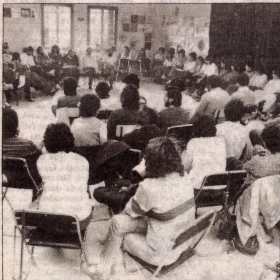
Ez litzateke txorakeria EGA ematen den bezala LEGA bat sortzea.