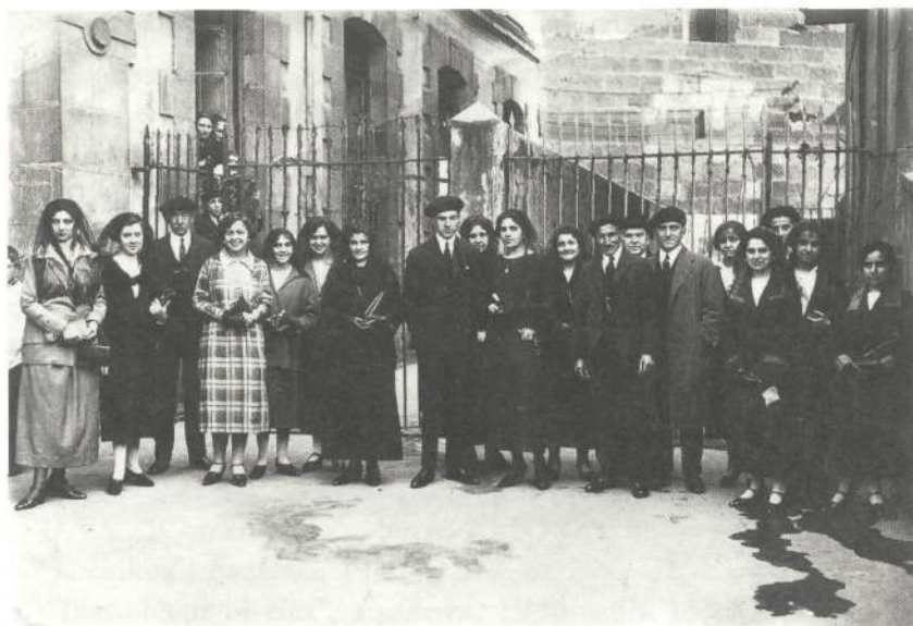
Ezkontza egunean, Abandoko San Bizenti eleizan (1925).