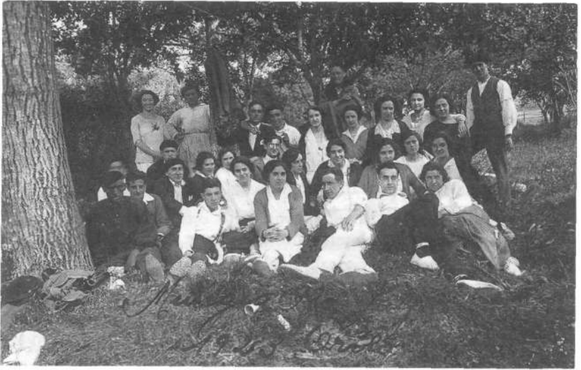
Mungiako jai baten (1923).