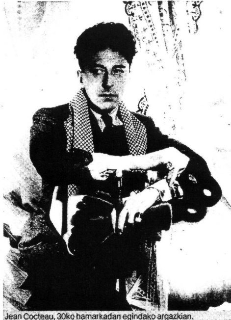
Jean Cocteau, 30ko hamarkadan egindako argazkian.

Hainbat ziklo eta ekitaldi programatu ondoren —Jean Cocteau eta Man Rayren film emanaldiak, esate baterako—, ekainaren 22an hasiko da jaialdia. Interesa piztu