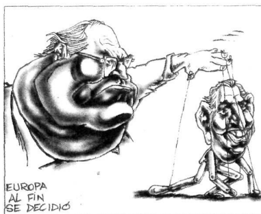
Europar azkenean erabaki bat hartu zuen. Baita Felipek ere.

Silvio Berlusconi Antonio Di Pietro eta bere taldeko epaileen azken bi urte hauetako lan izugarria lur azpira kondenatu du, hein handi batean, herenegun inposaturiko lege-dekretuarekin. Berlusconi komisio ilegalen eskandaluan burubelari sartuta zeuden bi mila politikoko eta enpresari inguru etxera bidali ditu, kartzeletatik kanpora alegia. Erabaki honekin, magnatearen garaipenak ekarri zituen asmo txarrenak gauzatu egin dira. Berlusconi Lehenengo Errepublikaren lurperatzaile bezala agertu zitzaigun, baina, azken finean, ustelkeriaren aurkako olatua aprobetxatu besterik ez zuen egin, gero —orain— benetako aurpegia azaltzeko. Ez da alfe-