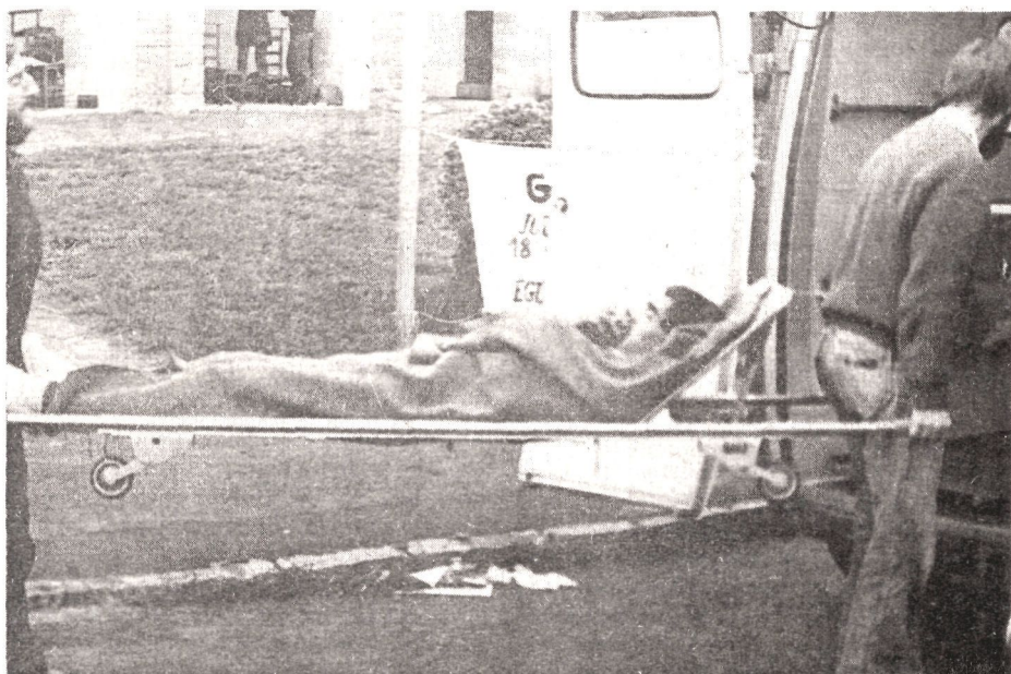
En camillas, al borde de la consumción son trasladados al hospital los refugiados vascos

Ez omen da sendimendu onekin politika onik egiten. Nahiz belaskeriek eta kaskarkeriek zer debru eraiki daiteke garbi ageri ez bazait ere. Nola liteke, ordea, inorengan gizona, politikariari; eta abertzalea, alderdikideari, ez nagusitzea? Nola uler daiteke kausaren alde dena eskaini eta eman duten horien egoera latzak,