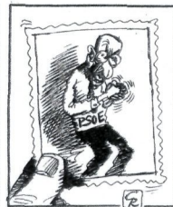
GALLEGO & REY / DIARIO 16

mende jartzen oinarrituta dago. Azken batean, helburua nazionalismoaren ezarpen formula kolektibistak izatea da eta horretarako nabiazeak da sozialista motako politika eta ekonomia garapen bat izatea.