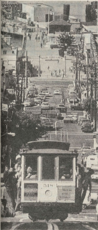
Tranbiak gora eta behera.

Kaian, «Pier 39» delakoan, eta in-guruko txamarilerietan, kutsu bera: txantxetan ari dira San Francisco-tar-rak. Donostia-ko arrain usaina bera kai-ondoko aterpeetan; baina arrainez gain, otarrainak eta xangurroak doze-naka, jendearen aurrean maneatuak. Mahainetan, horko «Pantxika»enean