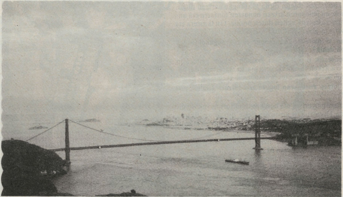
«Golden Gate» zubi zintzilikatua (munduko luzeenetakoa)

Alfonso Sastre-k esan bide zuen behin San Francisco dela munduko hiririk ederrena, edo horrelako zerbait. Eta beste askok gauza bera esan due-la, edo esango lukeela, sinetsita nago.