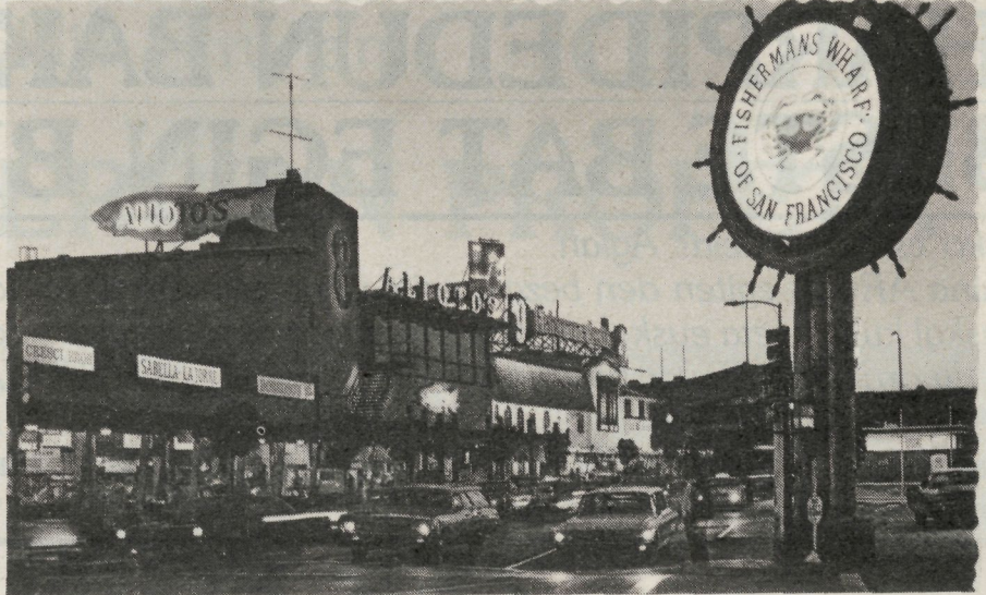
«Fisherman's Wharf», San Francisco-ko kai alai.

Kaian, «Pier 39» delakoan, eta in-guruko txamarilerietan, kutsu bera: txantxetan ari dira San Francisco-tar-rak. Donostia-ko arrain usaina bera kai-ondoko aterpeetan; baina arrainez gain, otarrainak eta xangurroak doze-naka, jendearen aurrean maneatuak. Mahainetan, horko «Pantxika»enean