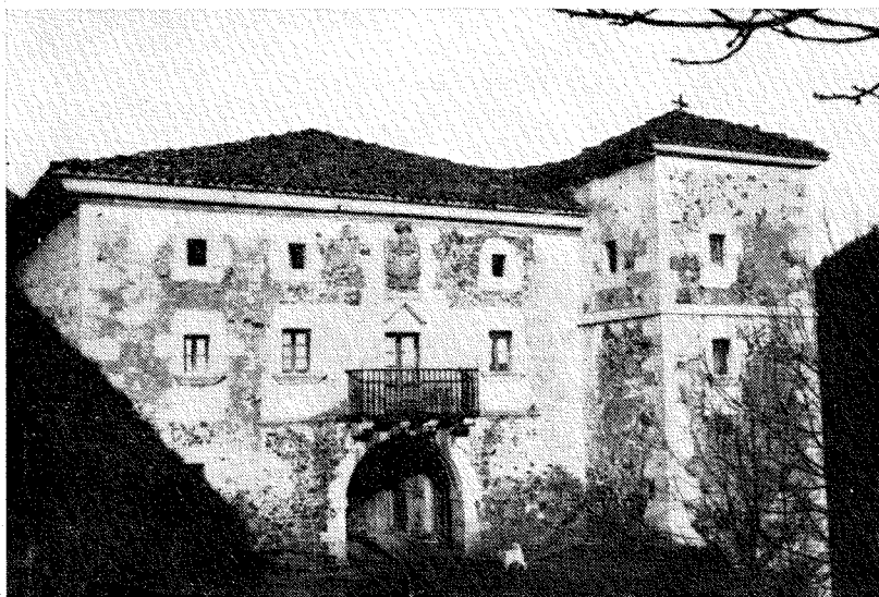
Casa-palacio de Sagarteguieta.

radica en Málzaga, en la vertiente de Arrate. Es de estilo neoclásico, del siglo XVIII. Muy probablemente sería construida sobre otra casa anterior, probablemente de las que llamamos caserío.