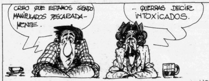
— Uste dut modu lotsagabeen manipulatzen ari zaizkigula. — ...txikatzen esan nahiko duzu. MANU / DEIA

buru biko gizona — epailearena eta goardiarena —, eta bokazio biko — magistratura eta politika —. Baina Belloch segituan kontradikzio bizidun eta nabaria